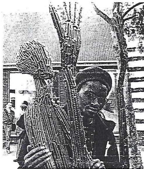
Ndary Lo, artiste sénégalais, expose jusqu'au 5 juin et sera en résidence à la Ferme d'En Haut jusqu'à la fin du mois.

Ndary Lo présente à la Ferme d'En Haut de nombreux marcheurs, « marcher, c'est pousser les gens vers l'action, surtout en