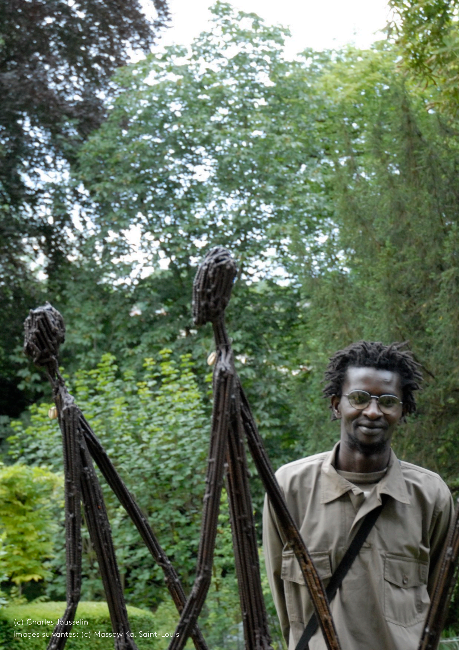
(c) Charles Jousselin Images suivantes: (c) Massow Ka, Saint-Louis