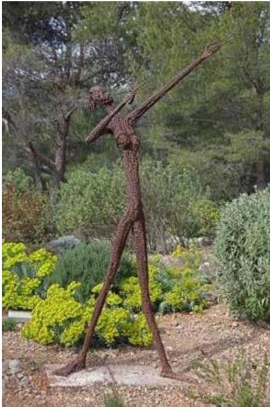
Ndary Lô L'ambitieuse 2011