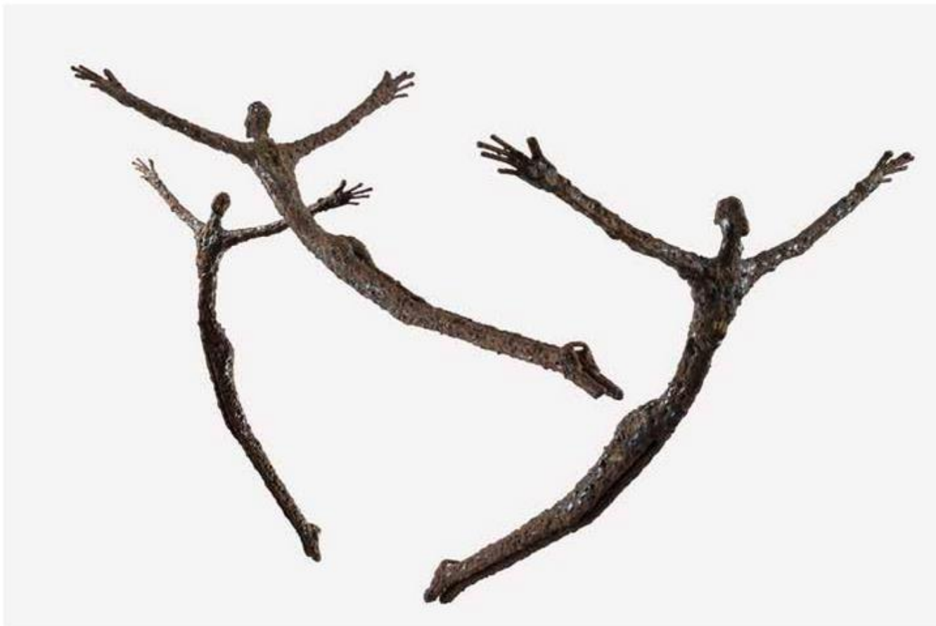
Ndary Lô Envols 2015 -